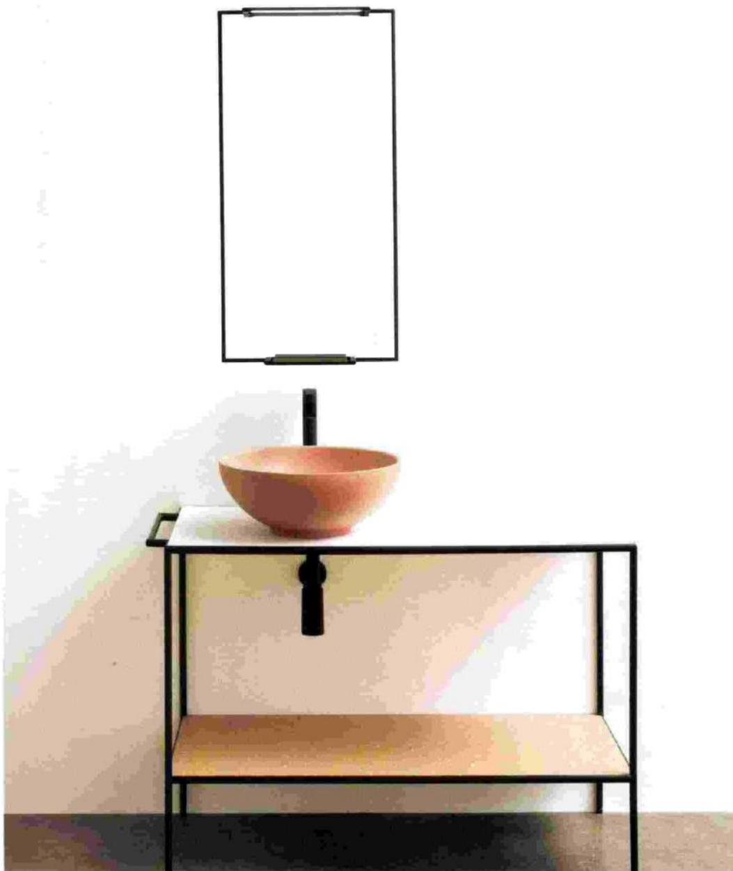
TUBY (DESIGN ARTER&CITTON) D'ARBLU