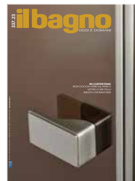
IN COPERTINA box doccia A180

Già da diversi anni Arblu è tra le aziende pioniere della sostenibilità, declinata non solo attraverso processi industriali e filiere controllate, ma anche attraverso l'ideazione di prodotti destinati a durare